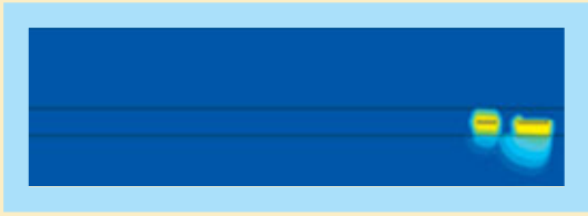
20 000 ans