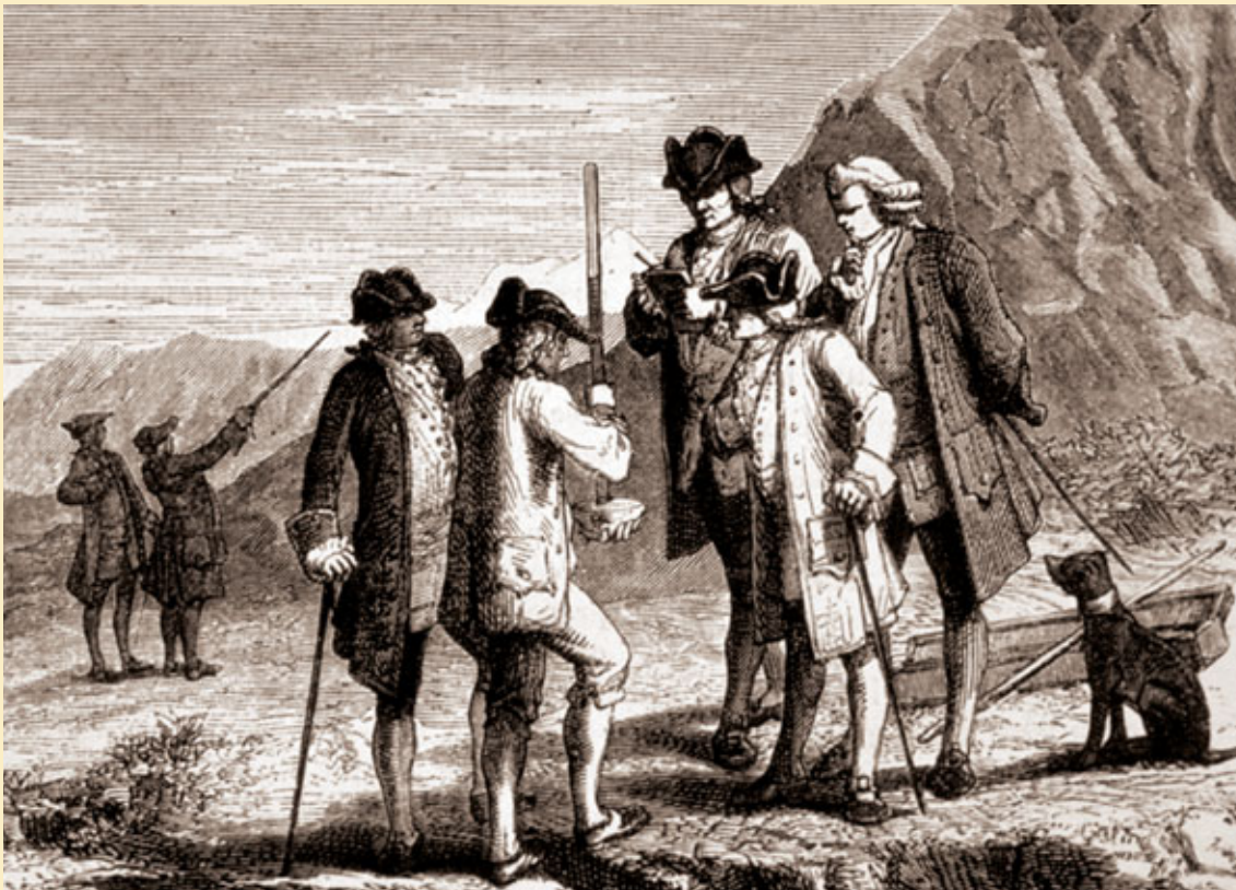
Palais de la Découverte

Et pour réaliser vraiment cette expérimentation comme toutes les autres, mieux vaut construire des cabinets, comme