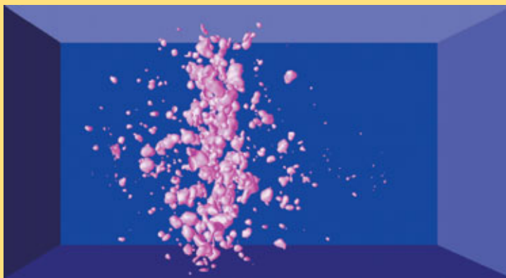
CEA – analyse réalisée par J. Bontaz-Carion et al.

Dans un autre ordre d'idées, la modélisation "comportementale" permet de s'assurer que des expérimentations ciblées et réduites en nombre peuvent être conduites sans risquer de "faire l'impasse" sur des paramètres déterminants.