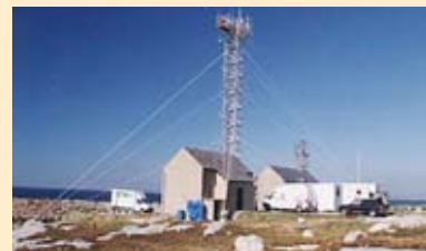
La station de mesure de Mace Head, en Irlande.

globale des émissions de ces gaz, de 5,2% en moyenne en 2008-2012 par rapport à 1990, pour les pays de l'OCDE et les pays de l'Europe de l'Est (dont la Russie). Les objectifs de réduction pour l'Union européenne et la France sont de respectivement 8% et 0%. Les moyens de les atteindre ont été débattus sans succès en novembre 2000 à La Haye . Les conférences suivantes, tenues à Marrakech (2001), Johannesbourg (Sommet de la Terre en août-septembre 2002), New-Delhi (octobre 2002), Moscou (septembre-octobre 2003) et Milan (décembre 2003) n'ont pas permis la mise en application dès 2004 du protocole de Kyoto , maintenant prévue en 2005, grâce à sa récente ratification par la Russie. Sous l'impulsion du programme des Nations unies pour l'environnement ( PNUE ), les problèmes posés par les substances appauvrissant la couche d'ozone atmosphérique ont été traités à Vienne (1985) et surtout à Montréal (septembre 1987) où a été signé le protocole imposant une réduction de la production et de l'utilisation des chlorofluorocarbures