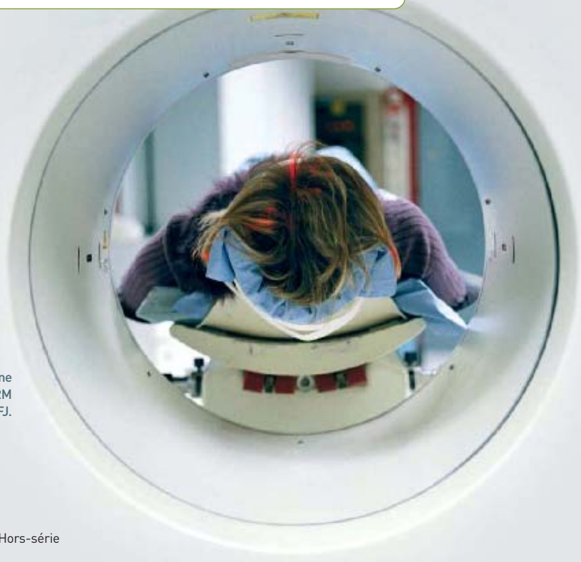
Patient dans une installation IRM au SHFJ.

— Un vaste complexe dédié à l'exploration du cerveau est en construction à Saclay. Baptisé NeuroSpin, il hébergera des machines d'imagerie par IRM aux performances inégalées, riches d'avancées en neurobiologie et en génétique.