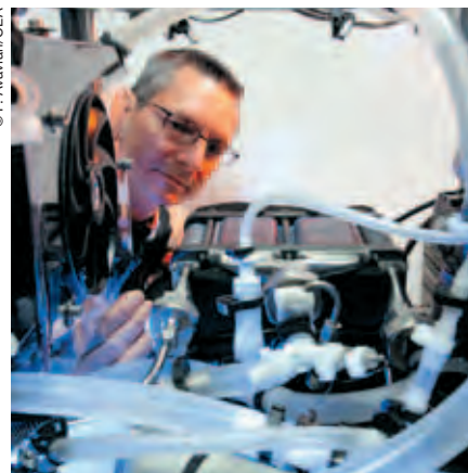
Groupe électrogène Epicea mobile et autonome pour pile à combustible.

Les travaux de recherche conduits dans le cadre de ce programme ont démontré le rôle indispensable du CEA pour apporter un soutien et une expertise au profit des pouvoirs publics, et pour proposer de nouvelles solutions technologiques en lien avec les besoins exprimés.