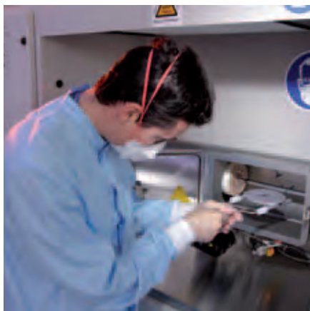
Dépôt chimique sous-vide sur le plateau technologique NanoS.