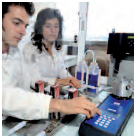
Développement de démonstrateurs terrain de détection de gaz toxiques.

Les enjeux des nanosciences sont d'abord scientifiques (observer, comprendre, fabriquer de nouveaux nano-objets et utiliser la compréhension des phénomènes et/ou les nano-objets au sein de systèmes pour des nouvelles applications), mais également sociétaux (analyse et maîtrise des risques, interaction avec la société, enjeux du développement durable, de la santé et de l'économie).