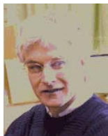
Donald Martin :

Mairbek Chshiev est un théoricien du transport électronique. Il est notamment spécialisé dans le calcul du transport électronique dans les composants à magnétorésistance géante (GMR) et à magnétorésistance tunnel (TMR) ainsi que dans la théorie quantique statistique du transport électronique polarisé en spin. Sa présence vient renforcer les compétences théoriques des équipes grenobloises travaillant dans le domaine de la spintronique, discipline qui se donne pour objectif de d'utiliser le spin de l'électron pour traiter et stocker l'information.