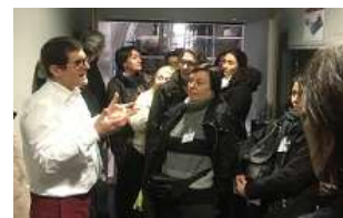
N. Sciaridis © CEA