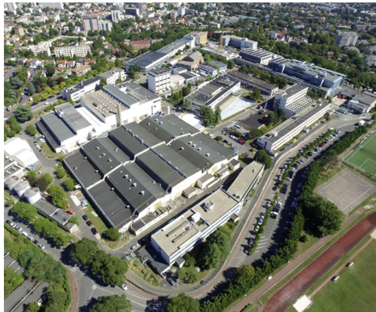
Vue aérienne du CEA/Fontenay-aux-Roses.