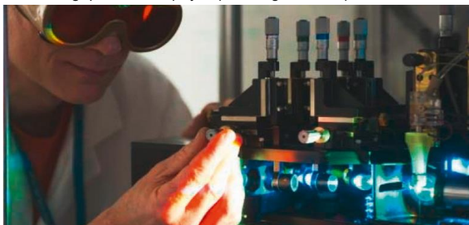
Réglage d'un trieur de cellules en flux, CEA-IRCM.

Le département IDMIT (Infectious Disease Models and Innovative Thérapies) est une unité mixte de recherche avec l'Inserm et l'Université Paris-Saclay. Il coordonne une infrastructure nationale. IDMIT se consacre à l'étude des maladies infectieuses, immunitaires et hématologiques, à leur physiopathologie, ainsi qu'aux inter-