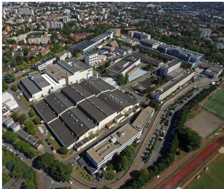
Vue aérienne du CEA/Fontenay-aux-Roses.