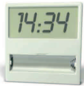
1 petit réveil digital