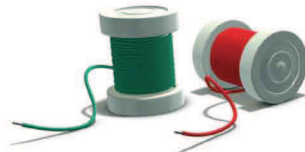
du fil électrique