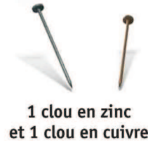
1 clou en zinc et 1 clou en cuivre