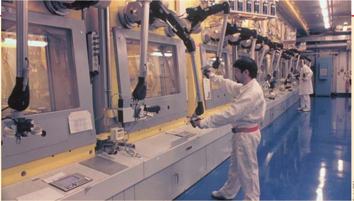
Techniciens aux télémanipulateurs d'une des chaînes de l'installation Atalante, au centre CEA de Marcoule. Blindées, ces chaînes arrêtent les rayonnements. Les opérateurs portent les dosimètres qui permettent d'en vérifier l'efficacité en permanence.

(ou stochastiques ). Une dose équivalente s'exprime en sieverts (Sv) ;