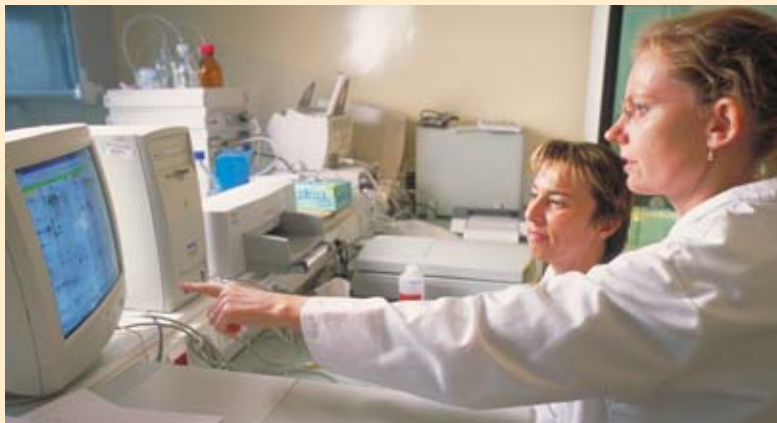
Analyse d'images de gels d'électrophorèse bidimensionnelle réalisée dans le cadre d'études de toxicologie nucléaire au centre CEA de Marcoule, dans la vallée du Rhône.

Certains métaux ou métalloïdes non toxiques à faible concentration peuvent le devenir à forte concentration ou sous leur forme radioactive. C'est le cas du cobalt, pouvant agir comme génétoxique , du sélénium (Se) (naturellement incorporé dans des protéines ou des ARN ), du technétium (Tc) et de l'iode (I).