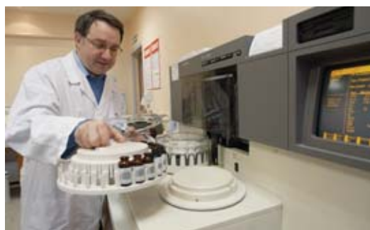
Laboratoire d'analyses médicales du CEA/Le Ripault (Indre-et-Loire).

souvent délicate à cause de diverses incertitudes portant notamment sur la forme physico-chimique des produits et parfois sur la voie d'incorporation, qui d'ailleurs n'est pas nécessairement unique. De plus, en suivi de routine, le moment précis de l'incorporation est rarement connu. L'estimation de la dose interne nécessite donc des investigations au poste de travail et des examens de contrôle qui permettent, par recoupement, de lever certaines incertitudes. Le nombre et la répétition des examens et les délais incompressibles d'analyse peuvent générer des contraintes temporelles parfois importantes dans le rendu d'une interprétation définitive (de l'ordre de plusieurs semaines, voire plus).