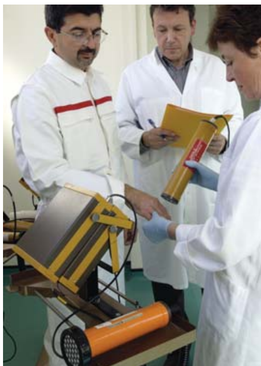
Contrôle de décontamination au Service de santé au travail (SST) du CEA/Saclay (Essonne).

Le calcul de dose nécessite des informations de la part de l'exploitant et des services de radioprotection , et une étroite coopération entre les SST et les LABM (figure). L'évaluation de la dose liée à l'exposition interne s'avère