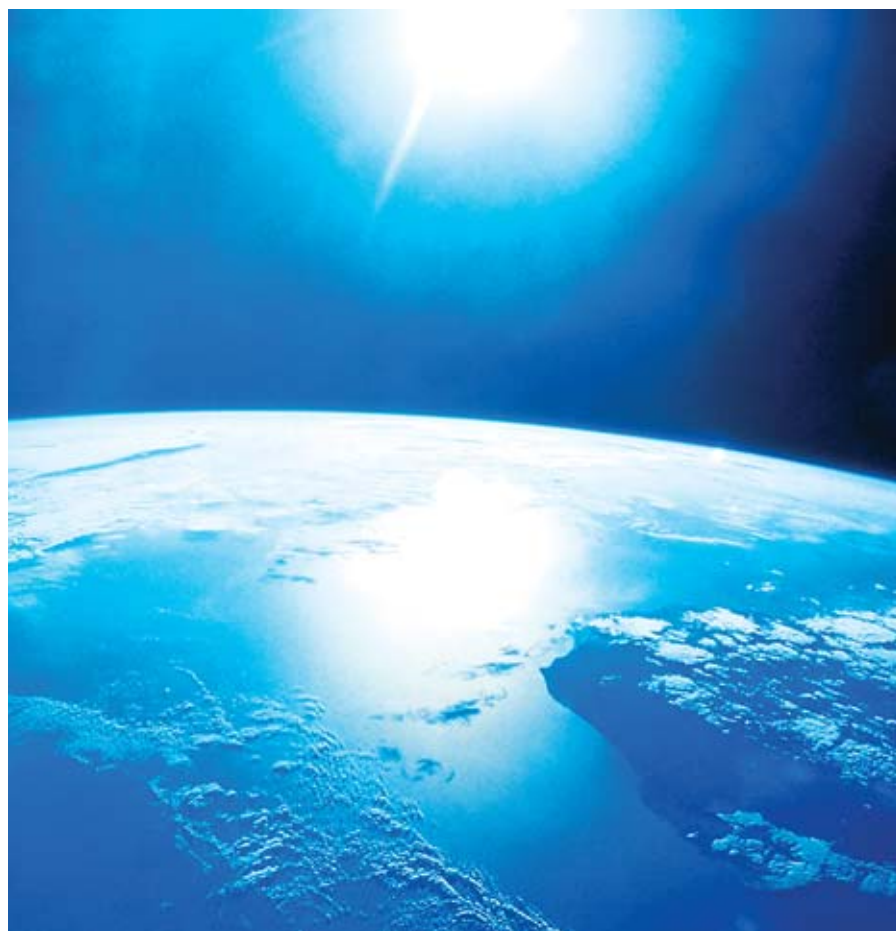
Reflets solaires sur l'atmosphère terrestre, vus depuis une navette spatiale.

Aux soleils mouillés de ces ciels brouillés, au soleil noir de la mélancolie, au grand soleil complice de ma joie répond cet incroyable laboratoire de physique, cette généreuse et inépuisable source d'énergie qui tout simplement s'appelle notre étoile le Soleil.