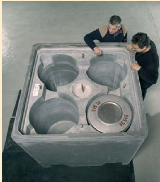
Concept étudié par le CEA de conteneur commun pour l'entreposage de longue durée et le stockage de déchets de moyenne activité à vie longue.

attente d'un mode de gestion à long terme de ces déchets. La reprise des colis entreposés est prévue à l'issue d'une période de durée limitée (années ou dizaines d'années).