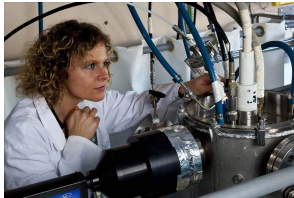
Exemples de la R&D du CEA sur les technologies biomasse : à gauche, installation PEGASE du centre CEA de Grenoble pour étudier les procédés de purification des gaz de synthèse. A droite, travaux sur la gazéification de la biomasse.