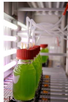
Photo prise sur la plateforme HelioBiotech du CEA de Cadarache, où on étudie les biocarburants de 3 ème génération.

Une troisième génération de biocarburants est encore à l'état de recherche, notamment à cause de son fort coût de production, de sa consommation énergétique élevée et de son faible rendement. Elle utiliserait non pas des plantes, mais des microorganismes photosynthétiques, capables de produire naturellement des molécules à forte valeur énergétique.